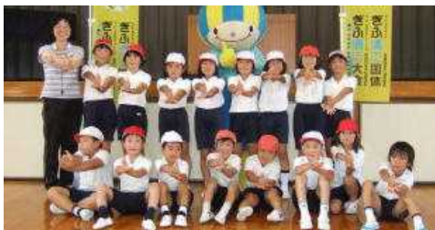
【「だれもが主役」のポーズ】

この日は今年の運動会の低学年(1年~3年)種目のミナモ体操の練習日。ミナモを含む5人のスタッフの方から、体操の指導を受けました。3年生はすでに踊ったことがありましたが、踊りの中に「だれもが主役」という手話が入っていることなど、新しいことも教えていただきました。たくさんほめてもらえ、これからの練習の励みにもなりました。