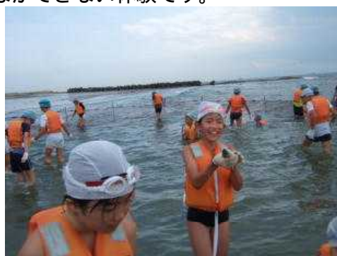
【やっとのことでつかまえました】

魚つかみの場所は、例年以上に広く張られた網の中です。アジは広い範囲を自由に泳ぎ回ります。皆、目をキョロキョロさせながら海面を見つめます。「いた！」とばかりに手を差し出しますが、そうそう簡単にはつかまえません。しかし、順々にあちこちから満面の笑顔がこぼれました。どの子にとってもつかまえる困難さは、予想以上だったに違いありません。