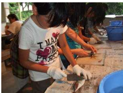
【うろこを上手にとります】

つかまえた魚は夕食の材料です。魚さばきを体験しました。調理師さんが魚の頭を落としたり、内臓を取り出したりする様子に顔をしかめて見ていた子ども達も、自分達の番となり、持ち慣れない出刃包丁を扱って、見事さばくことができました。