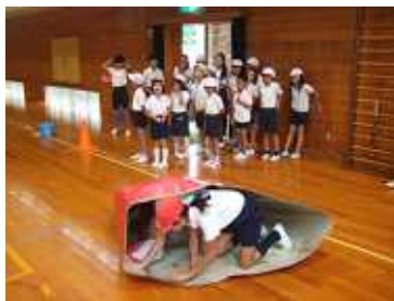
【盛り上がったリレー】

あさって17日は、午後1時から3時がワクワクくらぶ、午後3時からがおやしボランティアです。皆様にはたいへんお世話になりますが、よろしく願いいたします。